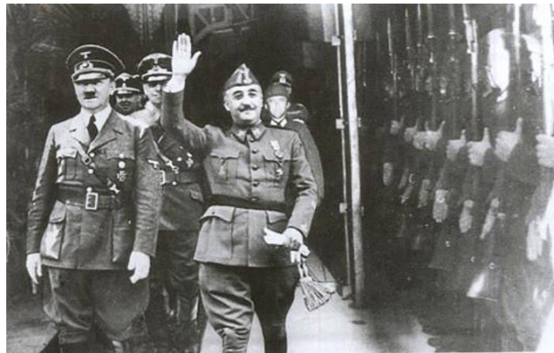
Adolf Hitler alemaniar diktadorea eta Francisco Franco espainiarra.