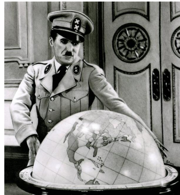
"El gran dictador" filmaren fotograma.