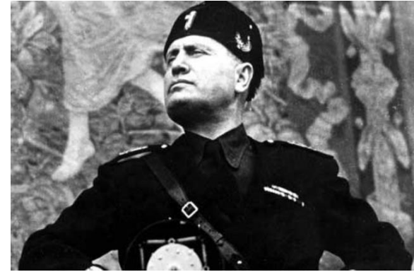
Benito Mussolini (1883-1945)