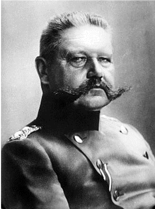
Hindenburg mariskala. Errepublikako presidentea izan zen 1925etik 1934ra.

1924.urtetik aurrera, gobernu berriak ekonomia-egoera konpontzea lortu zuen.