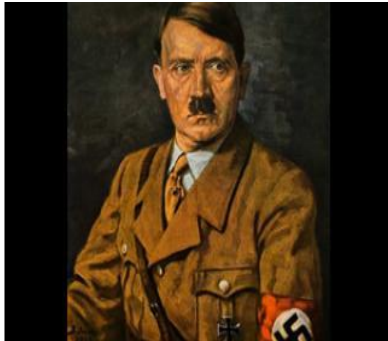
Adolf Hitler (1889-1945).

Hiru kargu nagusi: estatu buru, gobernu buru eta alderdi legal bakarreko presidentea.