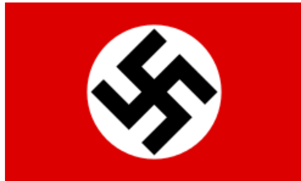
Alderdi naziaren ikurrina.

Ez zutenak onartzen ez ziren esatera ausartzen.