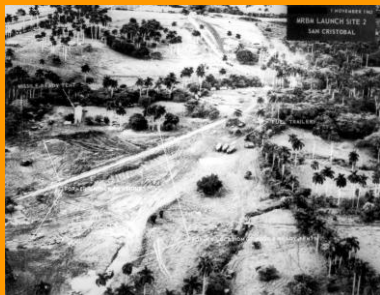
Misilak jaurtizeko toki bat