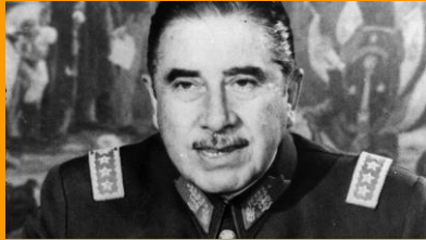
Pinochet (Txileko diktadorea)