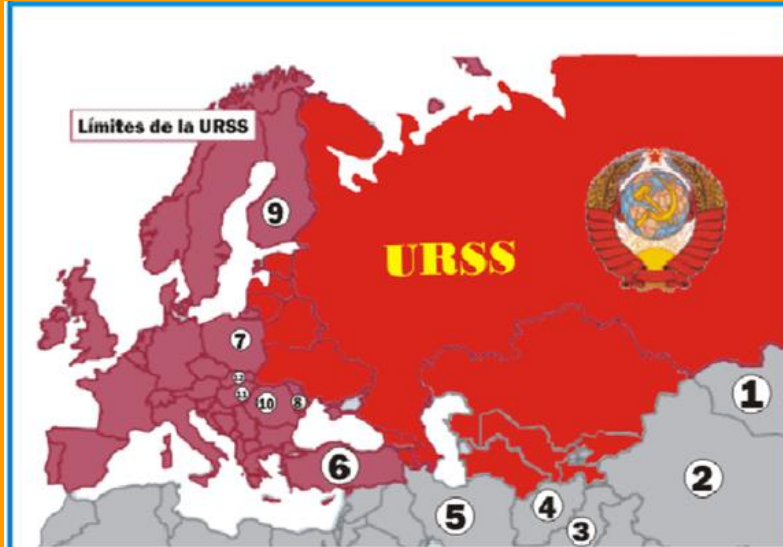
SESBko mapa (1960)

Varsoviako Ituneko soldaduek Pragako Udaberria deseztatu