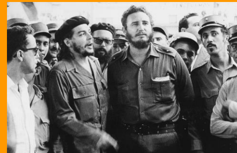
Che Guevara eta Fidel Castro