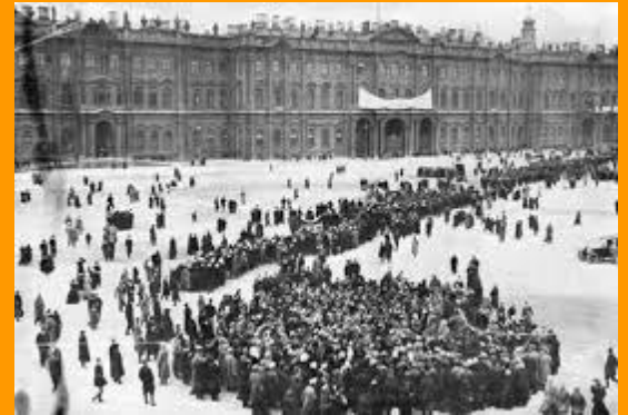
Urtarrilaren 9ko protesta, San Petesburgoko Neguko jauregia atzean duelarik