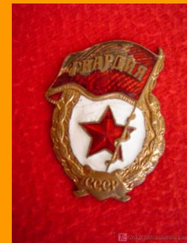
Guardia gorriaren domina