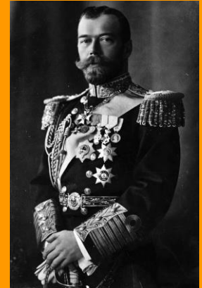
Nicolas II. tsar-a