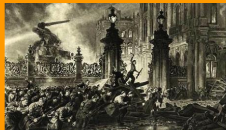
Neguko Jauregiaren eraso