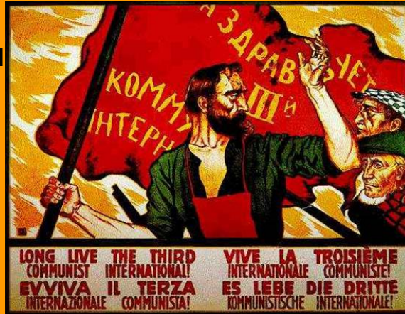
Hirugarren internazionalaren kartela